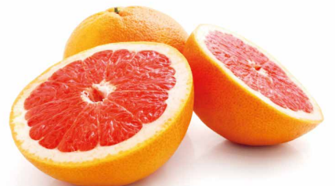
Manzana verde, Pera, Limón, Toronja