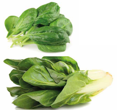
Escoge una o más - Lechuga Romana, Kale, espinaca, acelga.